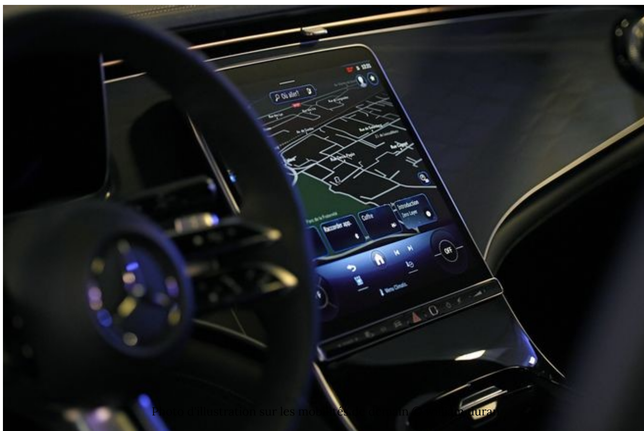
Photo d'illustration sur les mobilités territoriales durables